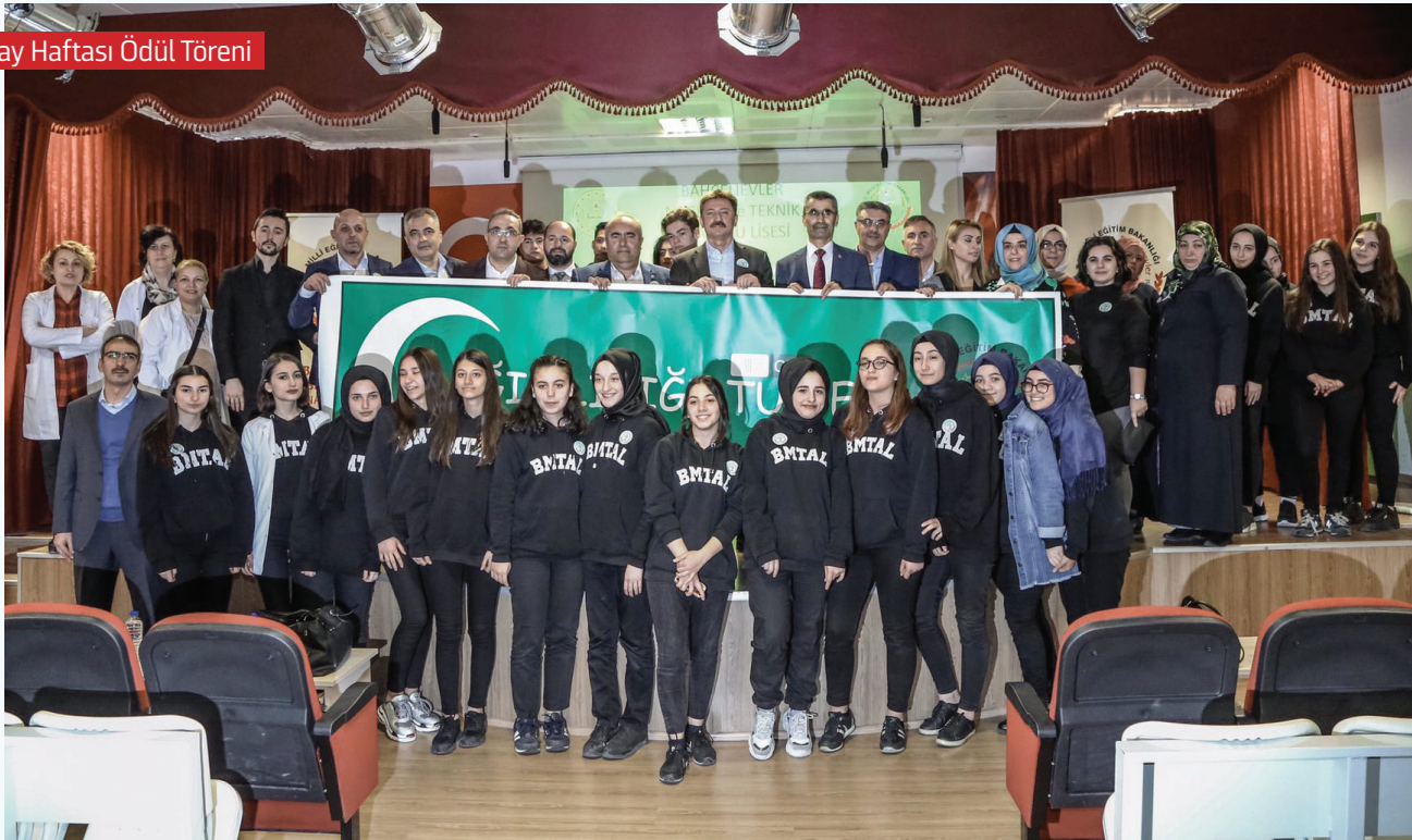
Yeşilay Haftası Ödül Töreni