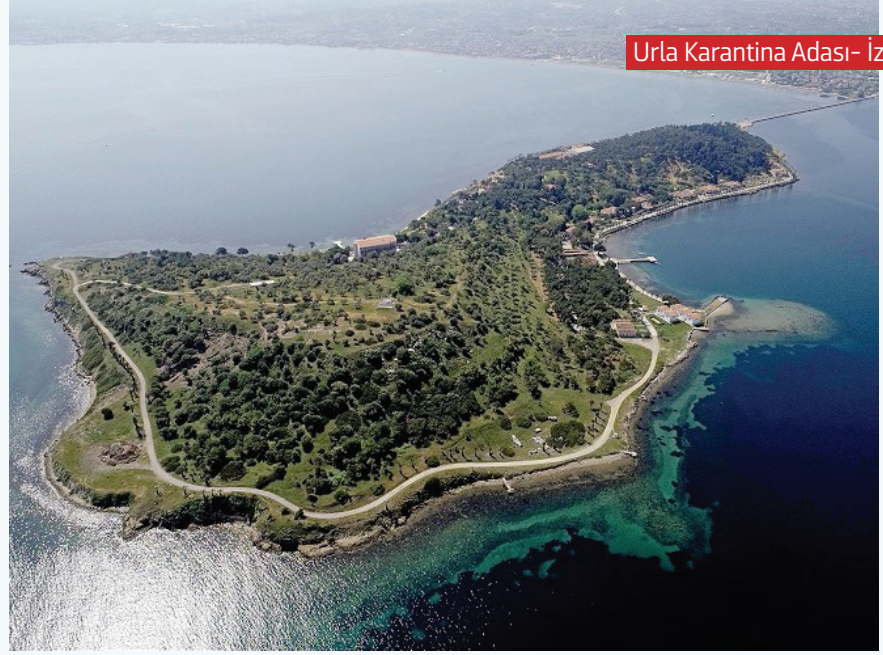
Urla Karantina Adası- İzmir

Sağlık çalışanları 7/24 mantığıyla gece gündüz çalışarak, hem hastanelerde, hem de filyasyon ekipleriyle evlerinde te-