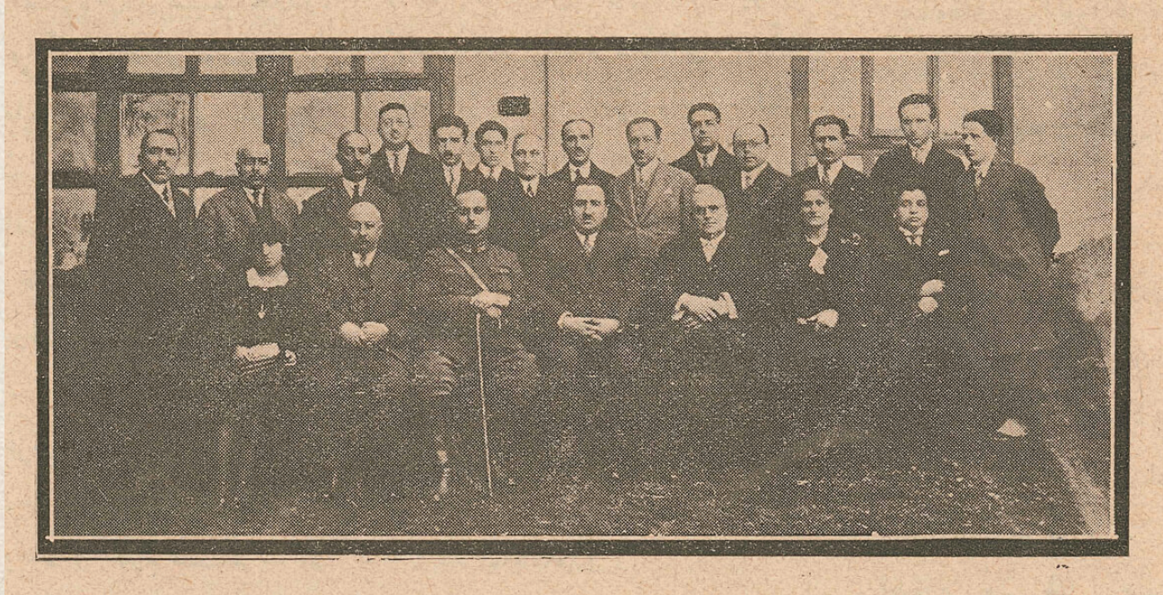
■ Yeşilay'ın Kurucuları Mazhar Osman ve arkadaşları

İnsanlık tarihinin başlangıcından beri uyuşturucu maddelerin keyif verici, ağrı giderici ve hastalıkları iyileştirici veya bir ritüel ara-