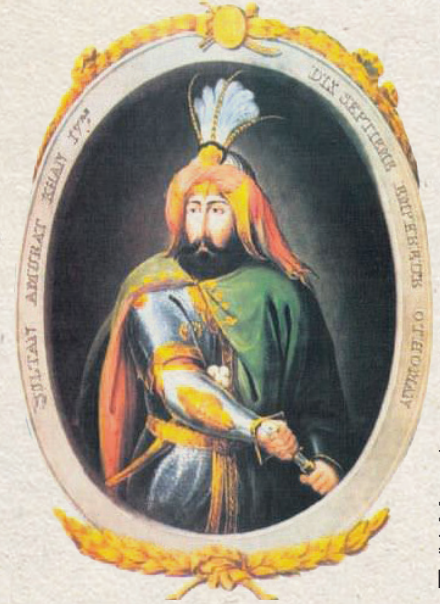
■ IV. Murad

konusunda çok sert yasaklar getirmiştir (1520-1566). İçki alınıp satılan yerler kapatılmış, gizlice içenlere şiddetli cezalar verilmiştir. Bu yasağın ilk günlerinde İstanbul'a şarap yüküyle gelen gemilerin yakıldığı anlatılır. Padişah 3. Murat meyhane açılması hakkındaki yasağı, sadece Müslüman mahalleleri için uygulamıştır. Kanuni'den sonra en şiddetli yasak IV. Murat dönemidir. Hem içkiyi hem tütünü yasaklamış, bütün meyhaneleri ve kahveleri yıktırmıştır. Yasağın uygulanıp uygulanmadığını kontrol etmek için geceleri tebdili kıyafet şehirde gezmiştir. IV. Murat'tan sonra yasaklar gevşetilmiş ama daha sonra alkollü içkiler tekrar yasaklanmıştır (1687-1691). Bazı padişahlar yasaklayarak, bazıları da