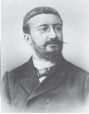
■ Alfred Binet