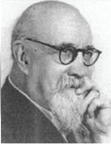
■ Théodore Simon