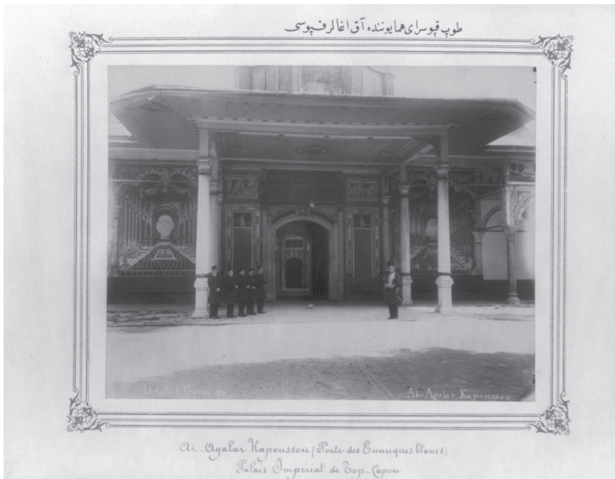
■ Enderun Mektebi'nin Girişi Akağalar Kapısı

Devletlerin birbiri ile rekabeti ile birlikte kendi iç sistemlerinin etkin yönetimi için insan kaynaklarının organizasyonuna düşen rol, bireylerin yeterliliklerinin ve yeteneklerinin potansiyellerini-performanslarını belirlemeyi önemli kılmıştır. Zekâ, yetenek, kabiliyet, istidat, muhakeme, dikkat, idrak, sabır, bedii yeterlikler, ruhi ve fiziki mukavemet, bedensel yeterlikler vb. özelliklerin ölçümü ve değerlendirmesi çalışmaları; 20. yüzyılın ilk yarısında dünyada olduğu gibi Türkiye'de de önem kazanmış ve bu alanla ilgili akademik çalışmalar ve saha uygulamaları yaygınlaşmaya başlamıştır.